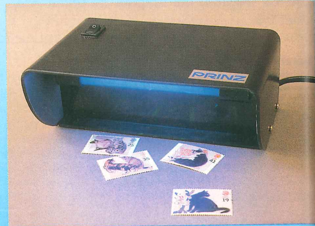
Lámpara de rayos ultravioleta empleada para detectar marcas o defectos imperceptibles al ojo humano. También se emplea en la detección de papel moneda falso.

Se emplean para facilitar la localización de marcas o defectos del sello, inapreciables a simple vista. Permiten captar la fosforescencia, los fallos en el papel, los hilos luminiscentes y el óxido. Las lámparas llamadas de onda corta son más útiles en determinados casos, pero su manejo exige tomar precauciones.