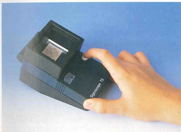
Filigranoscopio electrónico empleado para detectar posibles defectos o manipulaciones del sello, además de la filigrana si la hubiese.

Puede ser manual o electrónico. El primero consiste en un recipiente de fondo oscuro (cristal, baquelita, mármol) donde se deposita el sello para impregnarlo de gasolina pura, que revela la filigrana o marca de agua del papel o bien algún defecto o manipulación imperceptible a simple vista. El electrónico realiza esta función mediante lámparas y lentes, por lo que resulta más limpio y rápido, pero sólo tiene verdadera utilidad para coleccionistas avanzados.