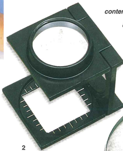
Lentes de aumento para contemplar y estudiar el sello: 1) lupa de 3,5 aumentos; 2) cuentahílos de 8 aumentos con distancia focal, y 3) cuentahílos de 10 a 15 aumentos sin distancia focal.

Los sellos contienen mucha información en poco espacio, por lo que los textos y motivos son casi siempre muy pequeños. Su contemplación y estudio requieren el uso de lupas, cuentahílos y microscopios, según los casos. La lupa suele tener 3,5 aumentos, con independencia de su tamaño o forma (cuadrada o redonda). Si la lente es de plástico, la lupa resulta más barata, pero acostumbra presentar distorsiones y su empleo continuado cansa la vista. Algunas lupas llevan luz incorporada, lo que facilita el examen del sello hasta el punto de que cabe considerarlas como las más prácticas y apropiadas. Para observar con mayor precisión algún detalle será preciso recurrir al cuentahílos, de 8 o 10 aumentos. La distancia focal la marca una plataforma inferior, por lo que el sello se debe colocar bajo ésta. Hay cuentahílos sin distancia focal y de 10, 15 y 20 aumentos, que en algunos casos se consiguen con la superposición de varias lentes, lo cual obliga a efectuar un ajuste, con la consiguiente incomodidad. A fin de lograr más detalle, en la observación de tramas o marcas para el estudio de las falsificaciones, se puede recurrir a pequeños microscopios de 25, 30, 40 y 50 aumentos. Pasar de esta última cifra no es aconsejable, pues el exceso de aumento reduce el campo de trabajo. Los microscopios suelen llevar luz incorporada.