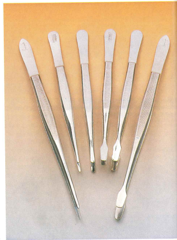
Surtido de pinzas empleado en filatelia para el uso y manejo del sello.